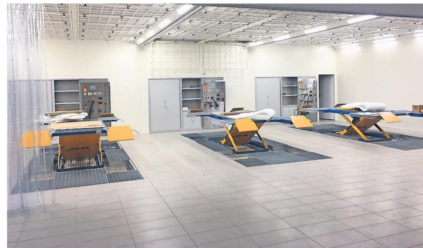
Die modernen Arbeitsplätze im Neubau

Der in einer Bauzeit von zehn Monaten entstandene Neubau ist 57 Meter lang und 25 Meter breit. Das Gebäude ist unterteilt in eine eingeschossige Werkhalle mit Zwischenböden zur Unterbringung der reichhaltigen Technik des Carrosseriewerks und einen zweigeschossigen Bürobereich, in welchem sich im