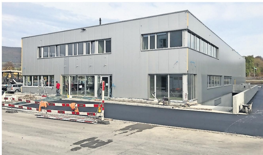
Die feinstrukturierte Metallfassade des Gebäudes

Das Gebäude tritt sowohl nord- als auch ostseitig stark in Erscheinung. Der grosse Vorplatz/Autoausserabstellplatz